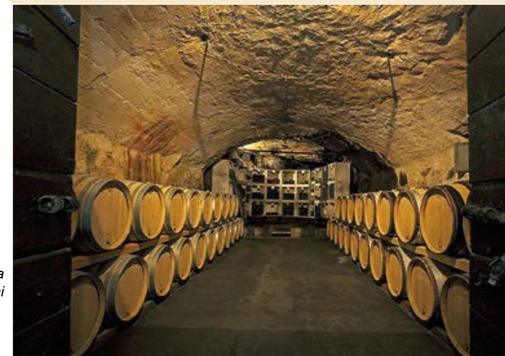
Il Crotto di Mese della cantina Mamete Prevostini